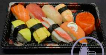
BOX 2 17,90€ SUSHI PARTY / 9P - sushi saumon/thon/daurade crevette/omelette/avocat/surimi saumon fumé cheese/tulipe ikura