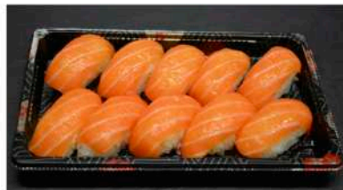
BOX 1 15,50€ SAUMON CLASSIC / 10P - sushi saumon